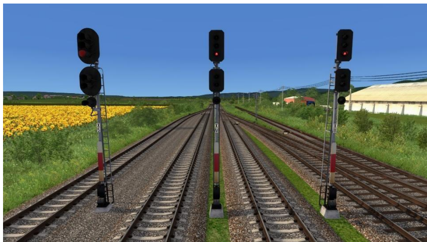
SEMNALIZAREA CĂII FERATE